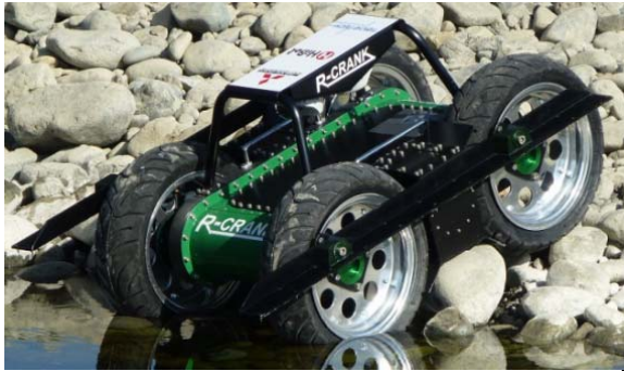
災害対応 ロボット