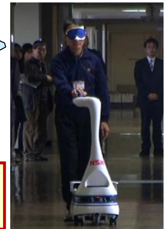
高齢者等への 生活支援ロボット

10市2町: 相模原市、平塚市、藤沢市、茅ヶ崎市、 厚木市、大和市、伊勢原市、海老名市、 座間市、綾瀬市、寒川町、愛川町